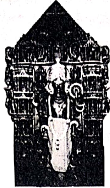
स्वयंम् त्रिविक्रम भगवान