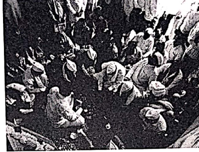
रथोत्सवाच्या प्रारंभाची पूजा