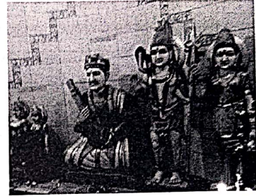
संत श्रेष्ठ कडोजी महाराज मंदिरात स्थापित झालेली मूर्ति

ही जत्रा/यात्रा लोकांना आकर्षित केल्याशिवाय राहात नाही. या रथोत्सवात उच्चारला जाणारा अजून एक शब्द म्हणजे कानगी. कानगी चा अर्थ काहीही न ठरवता देवाला दिलेली देणगी असाही असू शकतो कारण जेव्हा भाविक भक्त रथाचे दर्शन घेतात तेव्हा दर्शन झाल्यानंतर एक गुरुदक्षिणा म्हणून ते रथावर कानगी स्वरूपात देणगी देतात यालाच याठिकाणी कानगी म्हणून संबोधले जाते. या जमा झालेल्या कानगी चा वापर रथोत्सवाची तयारीसाठी केला जातो. मनातली इच्छा पूर्ण झाली, देवाला काही साकडे करायचे असेल तर त्या समोर ठेवून भाविक याठिकाणी कानगी देतांना दिसतात. कानगीच्या मोबदल्यात त्यांना प्रसाद म्हणून नारळ दिले जाते. या नारळाला पण खूप मान या रथोत्सवात आहे.