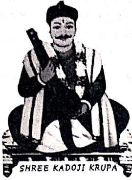
संत श्रेष्ठ कडोजी महाराज