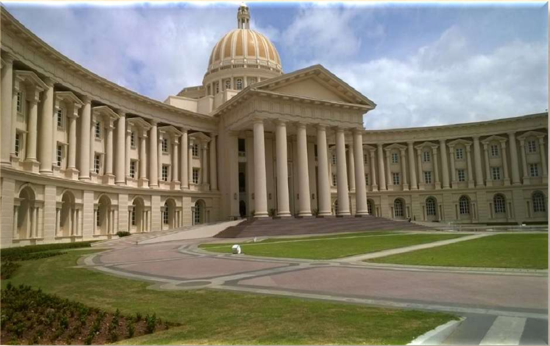
Impressive Training Center.....