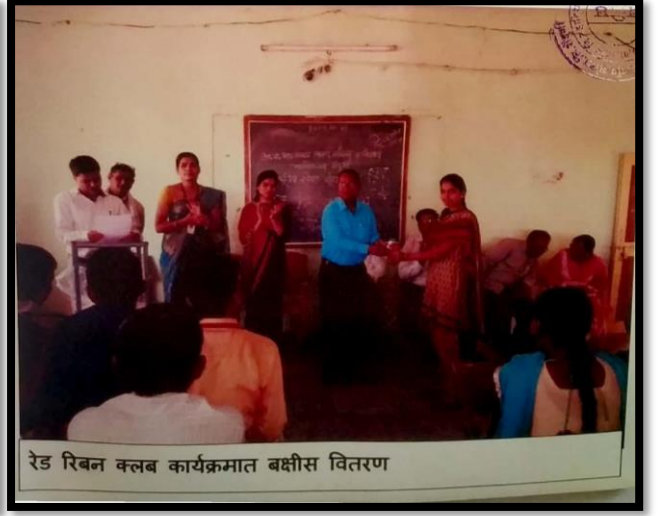
रेड रिबन क्लब कार्यक्रमात बक्षीस वितरण